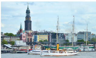
Treffpunkt beim Veranstaltungsort